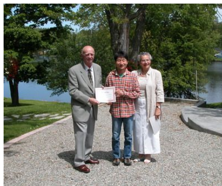
ガストンネサーン・アカデミー 修了証書授与 (カナダにて。ネサーン夫妻と共に)