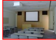
視聴覚・言語訓練室

東急東横線 都立大学駅下車 徒歩7分 目黒区八雲 1-1-8 TEL 03-5701-2221